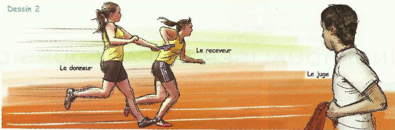
Tableau de validation